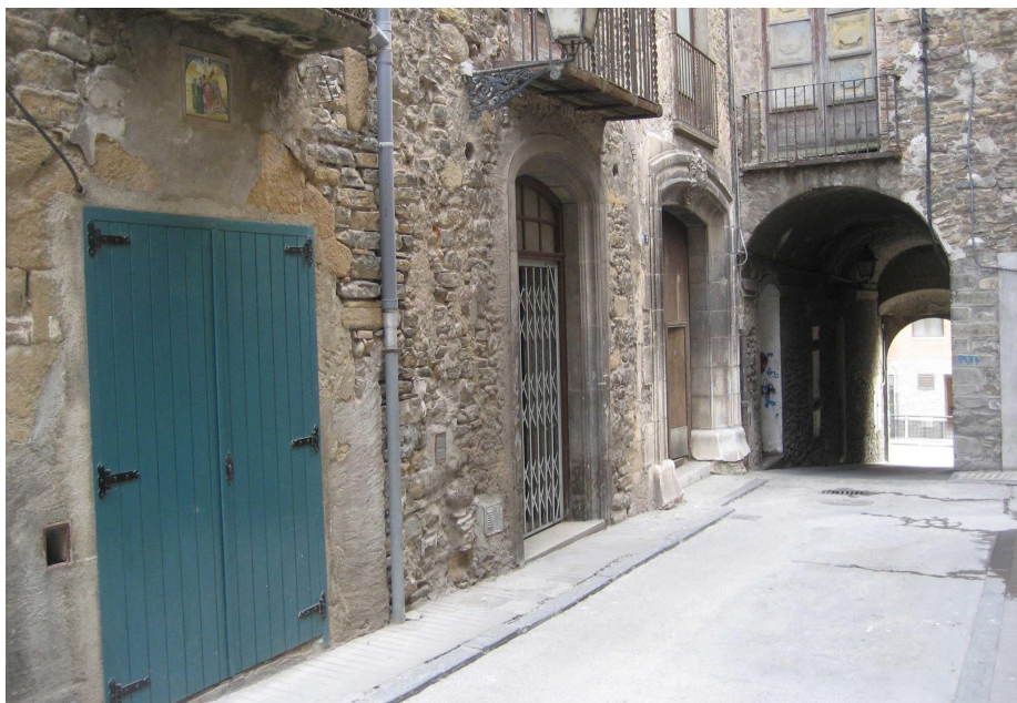
Detall de les restes de la casa dels Llorenç al carrer del Forn o Llorenç i Torres.