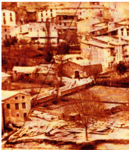
Foto del carrer del Raval amb les restes del molí edificat pels socis del Comú de Particulars.

A partir de llavors, el molí dels Llorenç va anar minvant el seu treball fins que el 1832 el seu fill, Josep